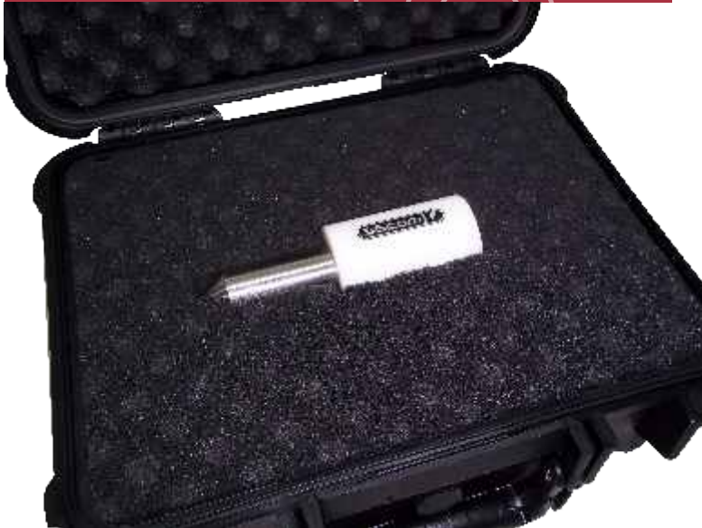
Test Probe 1 y 2